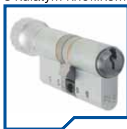
s kulatým knoflíkem