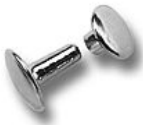
Nýty dvojitě sedlářské - uzavřené

» DŮM, STAVBA, ZAHRADA » DROBNÉ ŽELEZÁŘSTVÍ